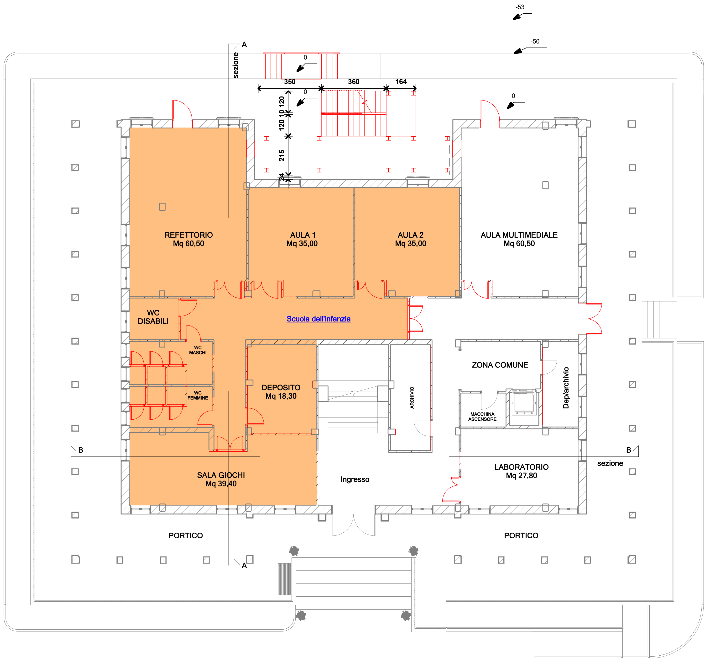
Pianta piano rialzato Stato di progetto Rapp. 1/100